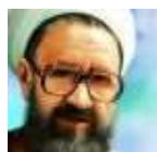
Shahid Mohammad Ali Rajaee